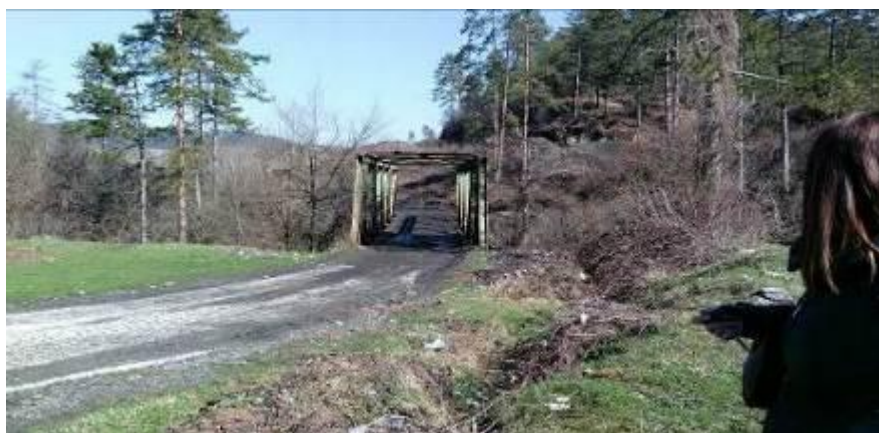
Slika 3: Most koji vodi ka lokaciji buduće regionalne sanitarne deponije preko Rijeke „Oskova“

Rijeka Oskova protiče na cca. 300 m zapadno od planirane lokacije tijela deponije. Planirano je da se rekonstruiše most preko rijeke Oskove (Slika 3) kako bi se omogućio pristup teških transportnih kamiona na lokaciju deponije.