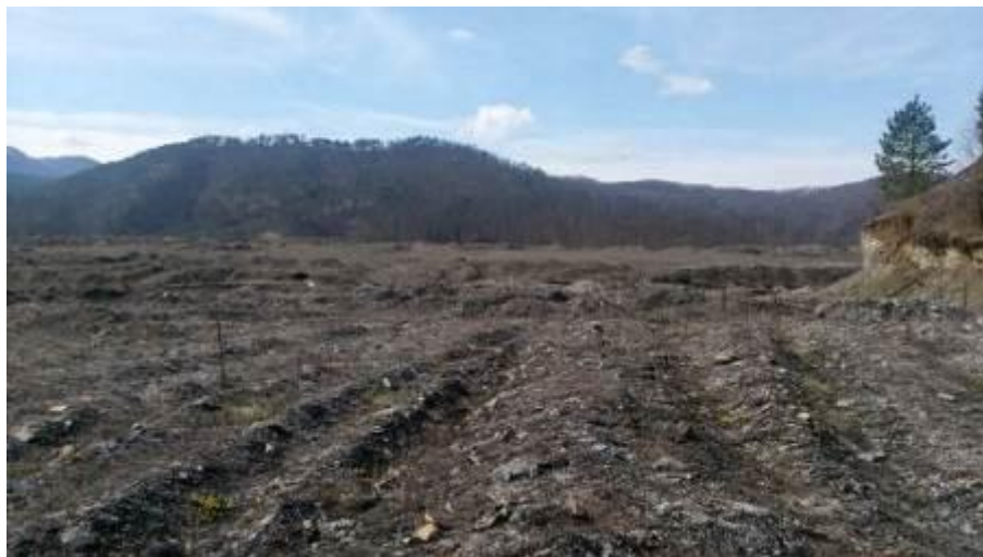
Slika 2: Trenutno stanje tijela deponije na lokaciji buduće regionalne sanitarne deponije

Do lokacije se može doći regionalnim putem R-469 Ribnica-Banovići-Živinice, koji je povezan sa lokalnim asfaltiranim putem dužine 1 km. Od lokalnog puta, neasfaltirani put vodi do ulaza na deponiju, dužine oko 1,2 km i širine 5-7 metara. Trenutno je u lošem stanju i morat će se rekonstruisati.