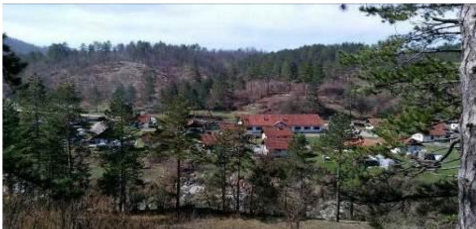
Slika 4: Prognaničko naselje "Ježevac"